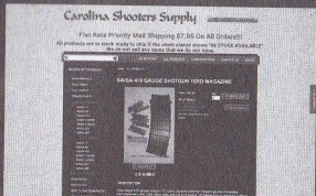
サイガ410の正規弾倉を販売する海外Webサイト「Carolina shooters Supply」。本体47.95ドル+送料7.95ドル

サイガ410で実際に射撃している様子が確認できるYouTubeの動画。その他にも「410 Saiga Shotgun with 922r Conversion」( https://www.youtube.com/watch?v=swynxkEZM ) などもある。猟銃の域をはるかに超えているのがよく分かる